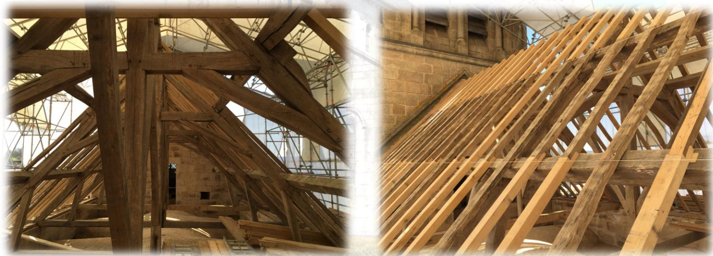
Le chantier charpente

La charpente : certaines parties telles les noues et les sablières, complètement désagrégées ont dû être changées. Tous les éléments de la charpente le nécessitant ont été changés (chevrons, poutres ...). Les voliges ont été posées sur la totalité de la partie restaurée en attente des ardoises. Ce très beau travail, qui ne se voit pas de la rue a été réalisé dans le plus grand respect du cahier des charges.