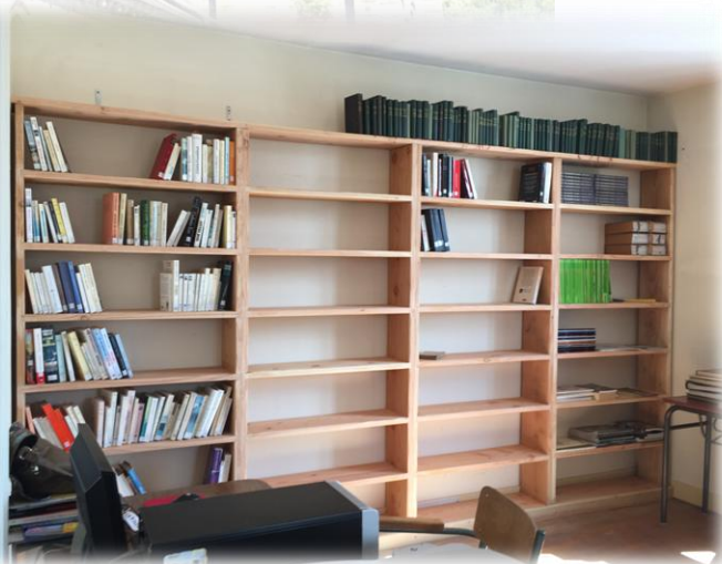
Le grand tri et les nouvelles étagères