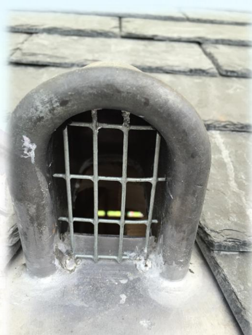
Les passe-barres (aérateurs)