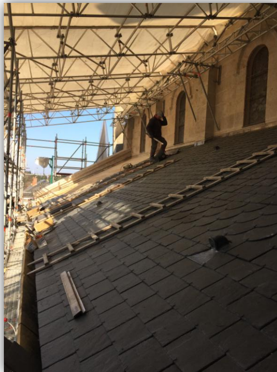
Travaux de couverture sur les bas-côtés