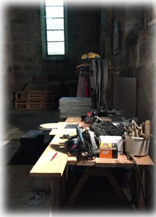
Atelier de découpe,