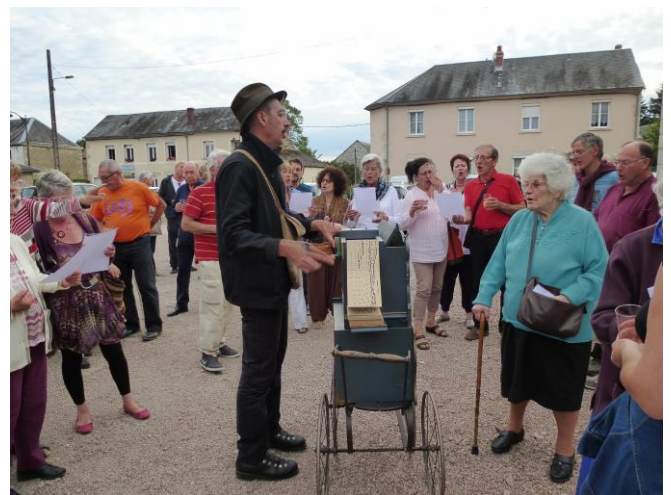
Apéritif au repas du Carrefour en Août 2016

20 € pour les non adhérents. Vous avez la possibilité d'adhérer le soir même du repas