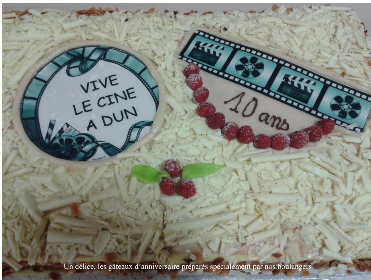
Un délice, les gâteaux d'anniversaire préparés spécialement par nos boulangers